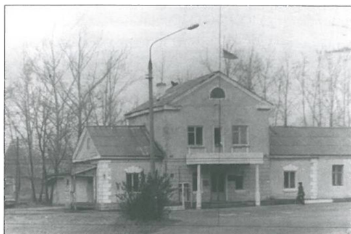
Здание поссовета. Опалиха. 1950-е годы