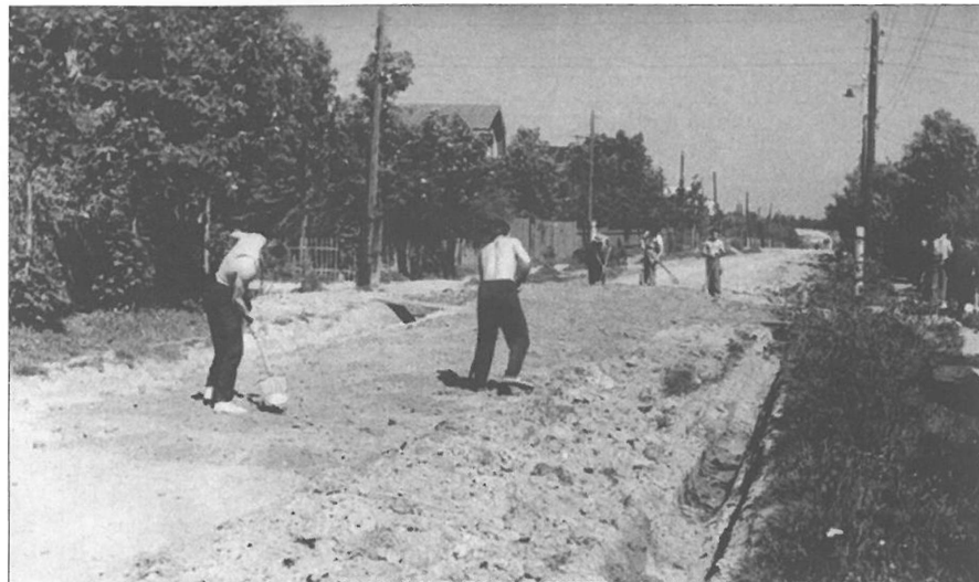
Воскресник по прокладке водопровода на улице Советской (ныне Есенинская). Опалиха. 1948

тресту Мосэлектрострой, Министерству геологии (для перевода из Пушкинского района в Опалиху дома отдыха «Серебрянка») и другим. После утверждения в соответствующих инстанциях генерального плана поселка сосны и ели, веками окружавшие жилые дома, были спилены, организации и около 500 индивидуальных застройщиков горячо взялись за дело, в расчистке улиц принимали участие и местные жители. Через четыре года поднялись новые дома, Опалиха разрослась и стала совершенно другой.