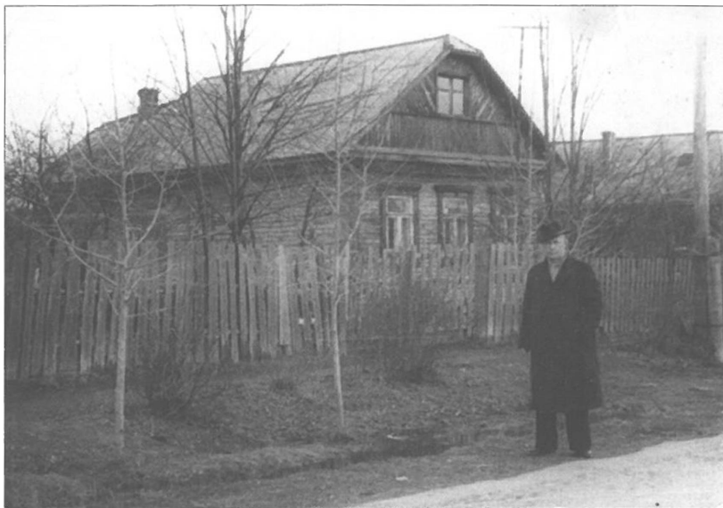
Т.Е. Березовский у дома на улице Советской (ныне Есенинская). Опалиха. 1950-е годы

она вышли на руководство ведомств, заводов и организаций, получивших землю под застройку для своих коллективов. Они составили план мероприятий, в нем были определены конкретные задачи, ответственные лица и сроки выполнения. И опять из Опалихи в Мособлисполком отправились ходатаи, где получили добро.