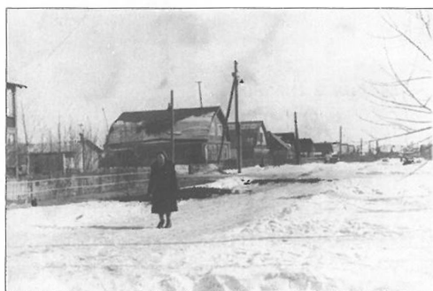
Улица Жуковского. 1950

К своему односельчанину часто обращались жители Опалихи по самым разным вопросам. Поселок в то время – это несколько улиц рядом с платформой: Железнодорожная, Советская и Садовая. Они располагались справа (если ехать из Москвы) и шли параллельно железнодорожным путям. Централизованное водоснабжение и канализация оставались несбыточной мечтой. Воду носили из колодца, на дне которого били ключи, сейчас на его месте пруд. Воды катастрофически не хватало. В летние дни колодец опустошали до самого дна. Послевоенная Опалиха жила натуральным хозяйством: держали коров, свиней, кроликов и птицу, на полянах в лесу косили сено, у каждой семьи был свой огород.