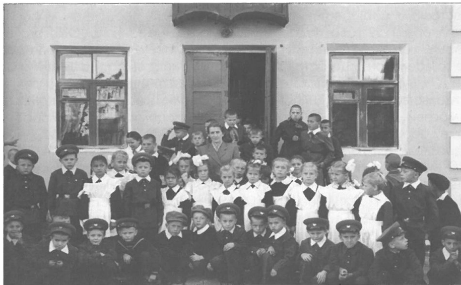
Первое сентября в школе на улице Чкалова. Опалиха. 1958