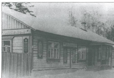
Ателье. Опалиха. 1950-е годы