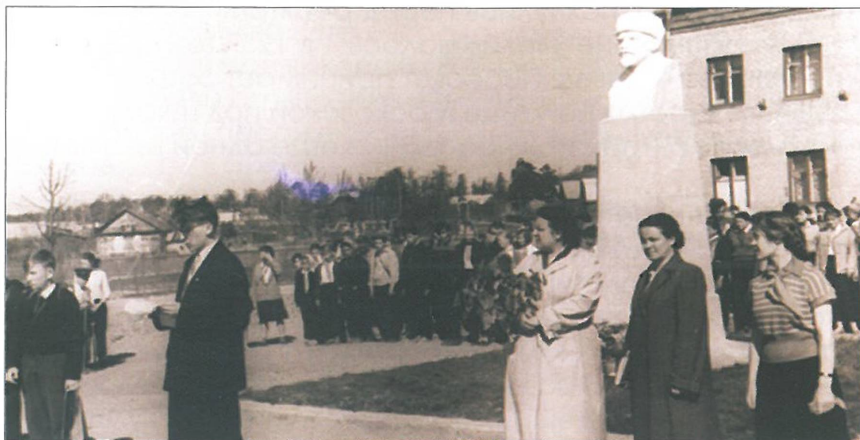
Митинг на открытии памятника В.И. Ленину. Опалиха. 22 апреля 1960 года

В 1956 году поссоветом утверждается пятилетний план благоустройства Опалихи с финансированием в размере 7 миллионов рублей, который был выполнен в полном объеме. В итоге она стала одним из самых благоустроенных поселков области.