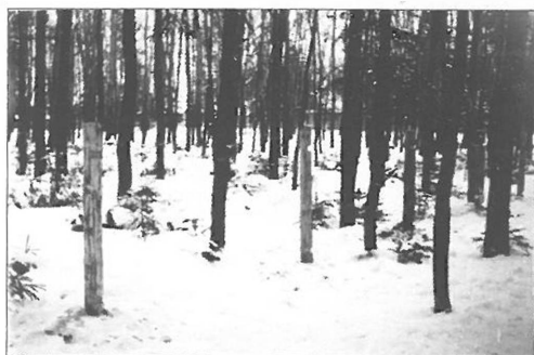
Здесь будет улица Жуковского. Опалиха. 1948

Власти Красногорского района, потерявшего более семи тысяч мужчин за годы войны, бывшему комиссару подобрали соответствующую его опыту должность – председателя Ново-Никольского сельсовета. И фронтовик с присущей ему энергией приступил к работе.