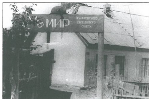
Клуб «Мир». Опалиха. 1950-е годы