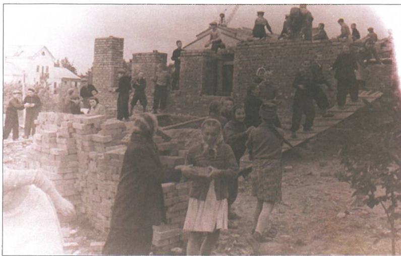
Воскресник на строительстве поликлиники. Опалиха. 1950-е годы

Жители пришли на помощь и тогда, когда надо было принимать противопожарные меры. В начале пятидесятых в Опалихе возникло несколько пожаров, тушить их было нечем. Люди волновались за судьбу своего деревянного поселка. По заданию поссовета в срочном порядке были выкопаны три противопожарных водоема, но этого явно было недостаточно. Принимается решение сделать котлован под пруд. Снова на помощь приходят шефы – они выделяют бульдозер. Осенью 1953 года был расчищен участок, вырыт котлован и насыпана грунтовая дамба. Однако весной возникла опасность ее разрушения. Сотни людей вышли, чтобы предотвратить беду и спасти водоем. Так в поселке появился пруд, который существует и ныне. Он стал излюбленным местом отдыха.