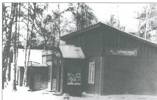
Парикмахерская. Опалиха. 1950-е годы