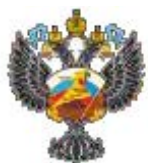
МИНИСТЕРСТВО СПОРТА РОССИЙСКОЙ ФЕДЕРАЦИИ