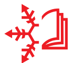
газетный киоск/ книжный магазин