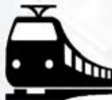
Железнодорожные пути необщего пользования