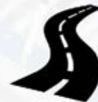
Дорожная инфраструктура (автомобильные дороги)