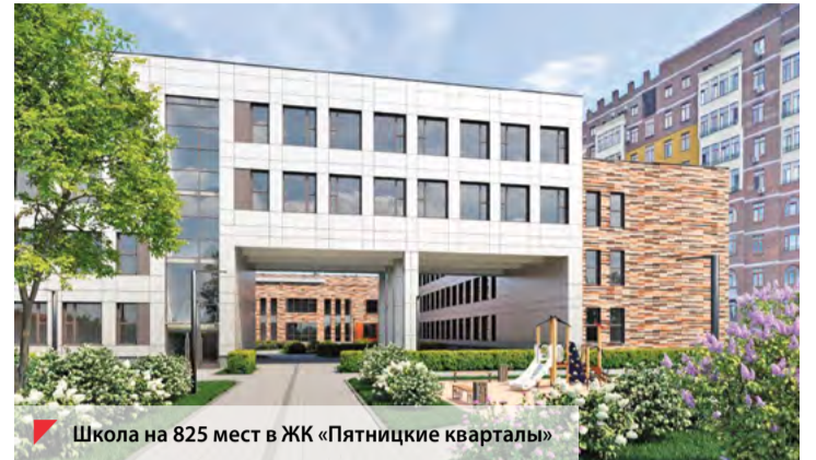
Школа на 825 мест в ЖК «Пятницкие кварталы»