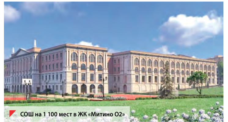
СОШ на 1 100 мест в ЖК «Митино О2»