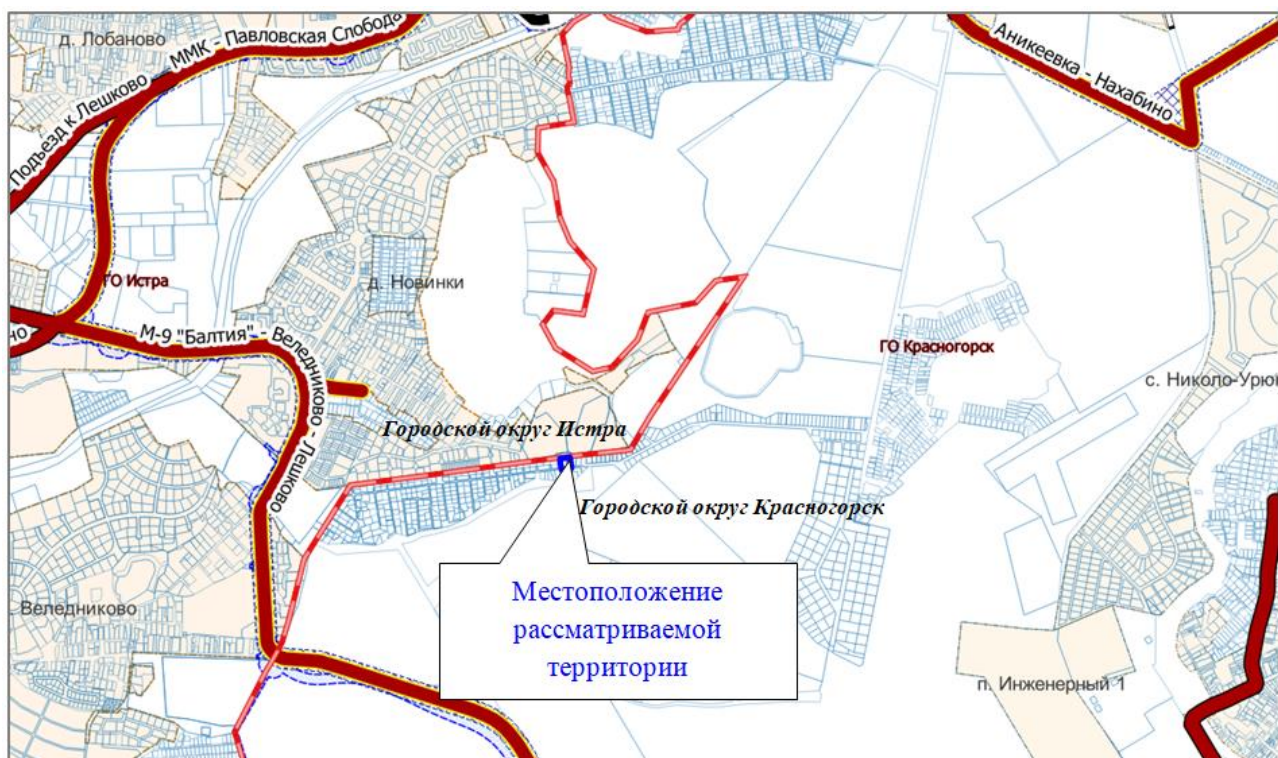
Рис. 5.1.2 Фрагмент «Схемы территориального планирования транспортного обслуживания Московской области» городского округа Красногорск Московской области, применительно к территории земельных участков 50:11:0040106:439, 50:11:0040106:438

Объекты федерального и регионального значения в материалах генерального плана городского округа отображаются в целях обеспечения информационной целостности документа и утверждению в составе данного документа не подлежат