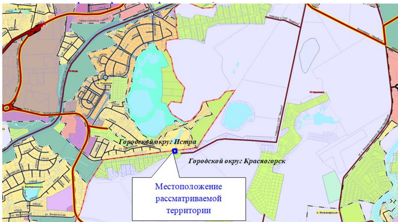
Рис. 5.1.1 Схема внешних связей городского округа Красногорск Московской области, применительно к территории земельных участков 50:11:0040106:439, 50:11:0040106:438

Внешние транспортные связи рассматриваемой территории осуществляются автомобильным транспортом (см. рис. 5.1.1).