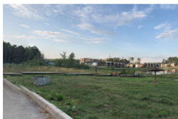
Дата съемки: 10 октября 2017 года