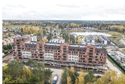
Дата съемки: 24 мая 2017 года