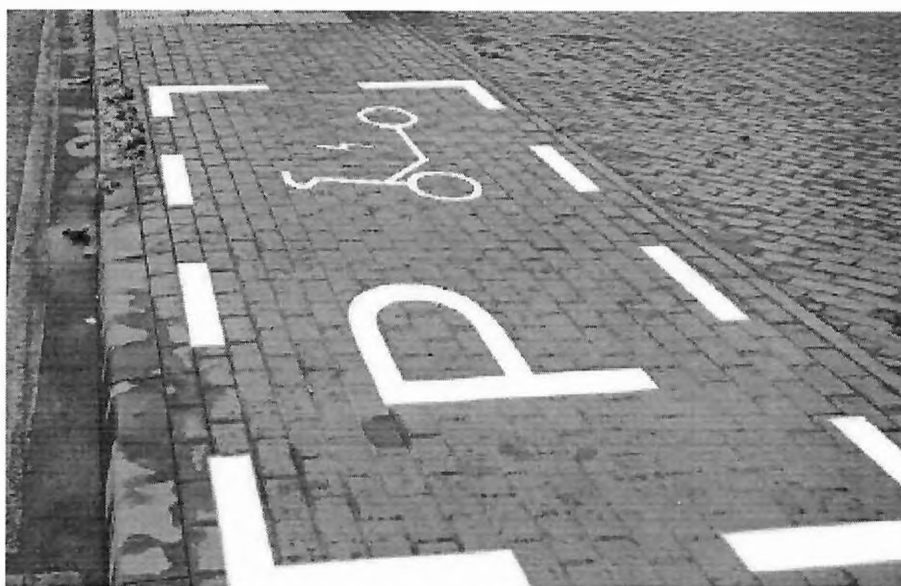
Дорожная разметка для СИМ на 10

Требования к разметке мест размещения средств индивидуальной мобильности на территориях общего пользования городского округа Красногорск Московской области