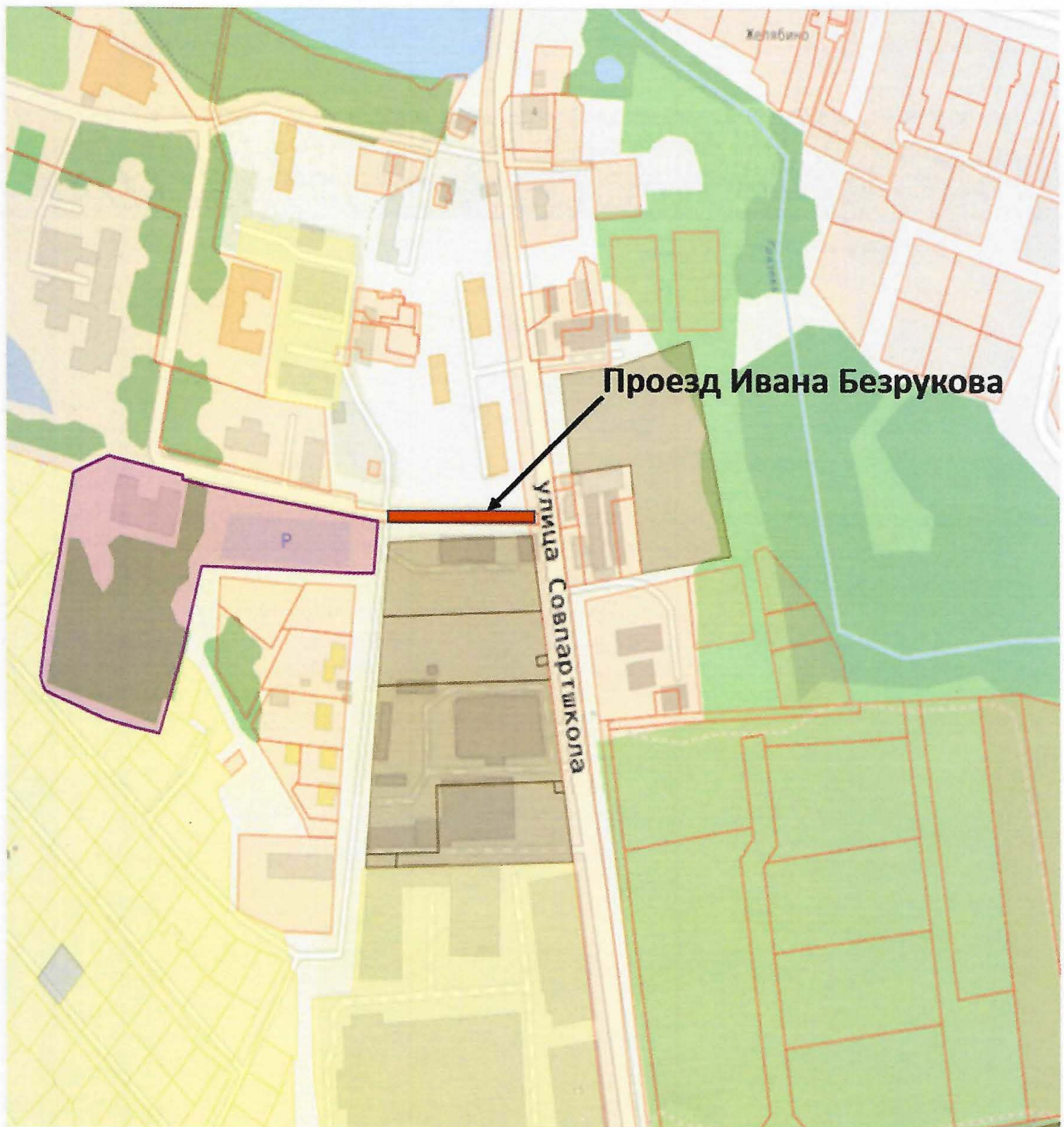
Схема размещения элемента улично-дорожной сети расположенная по адресу: Московская область, г. о. Красногорск, пгт. Нахабино, улица Совпартшкола – проезд Ивана Безрукова

Глава городского округа Красногорск « 23 » 04. 2026 г.