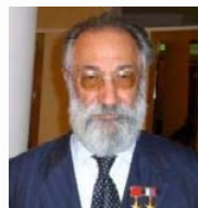
Чилингаров Артур Николаевич Депутат Государственной Думы 7- го созыва