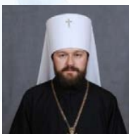
Митрополит Иларион Председатель Отдела внешних церковных связей Московского Патриархата