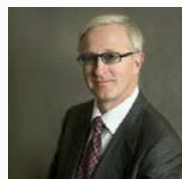
Шохин Александр Николаевич Президент Российского союза промышленников и предпринимателей