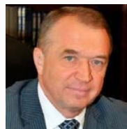
Катырин Сергей Николаевич Президент Торгово-промышленной палаты Российской Федерации