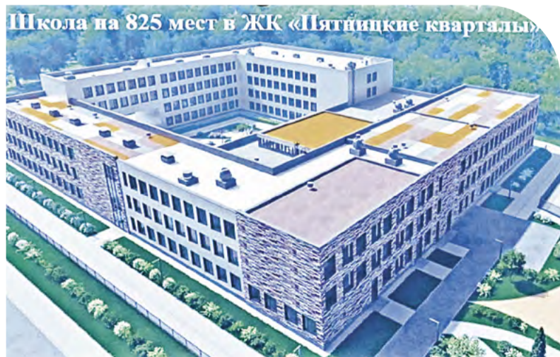
Школа на 825 мест в ЖК «Пятницкие кварталы»