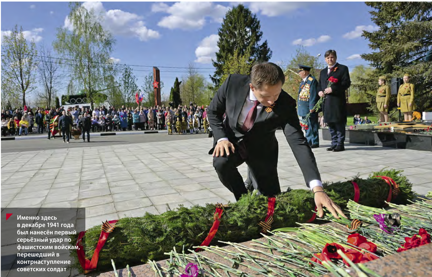
Именно здесь в декабре 1941 года был нанесён первый серьёзный удар по фашистским войскам, перешедший в контрнаступление советских солдат