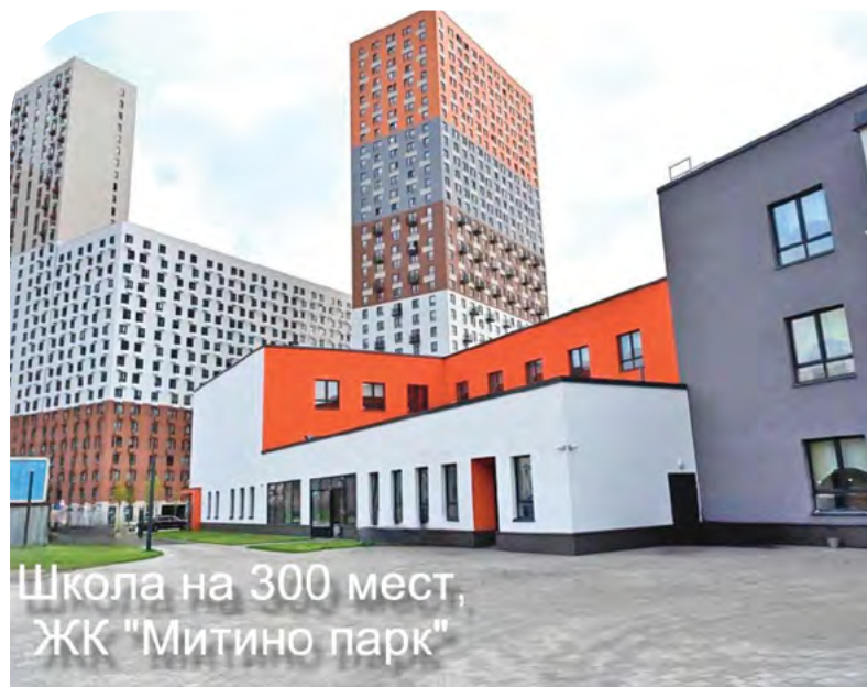
Школа на 300 мест, ЖК "Митино парк"

Президент РФ предложил запустить в России несколько новых национальных проектов, в том числе «Кадры» и «Молодёжь России». По его словам, новый национальный проект «Кадры» будет направлен на тесное объединение всех уровней образования – от школы до вуза. С этой целью