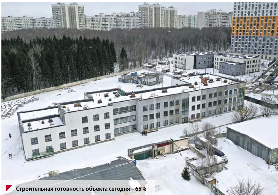
Строительная готовность объекта сегодня – 65%