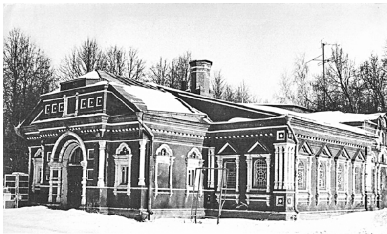
Иван Фёдорович Волынский построил в 1683 году скромную церковь с небольшой трапезной и колокольней в честь Знамения Пресвятой Богородицы

* При подготовке статьи были использованы материалы из книги Е.Н. Мачульского «Красногорская земля» (второе издание), «Красногорские пенаты» М. Ногтевой, с официального сайта усадьбы и из открытых источников.