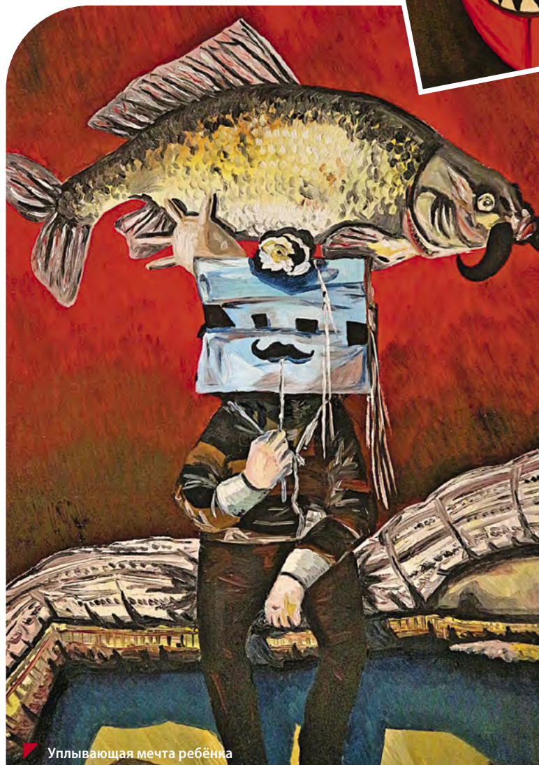
Уплывающая мечта ребёнка

Большинство родителей малышей знают «Синий трактор»