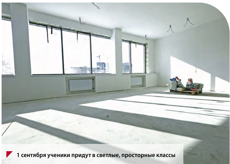
1 сентября ученики придут в светлые, просторные классы

Виктория ШУСТОВА.