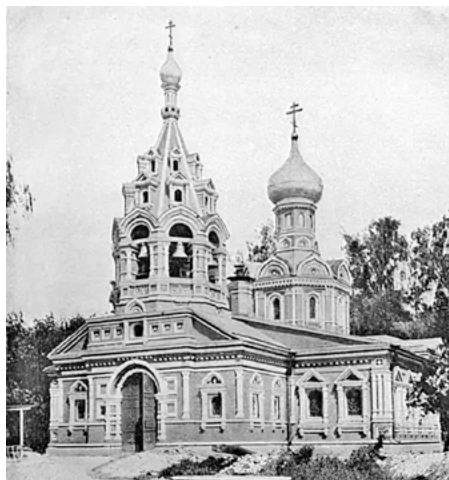
В период перестройки храма