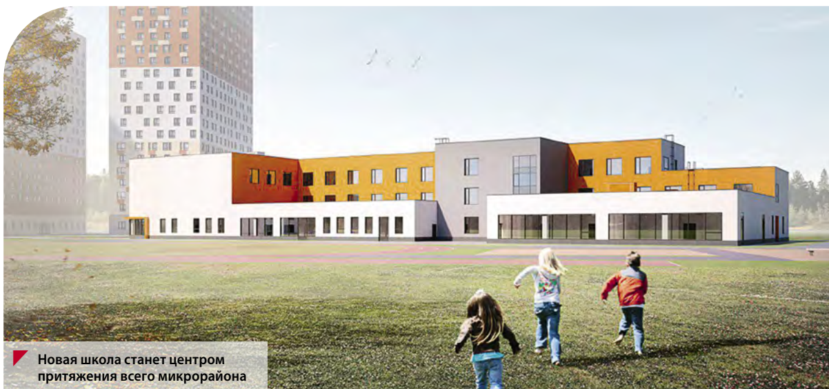
Новая школа станет центром притяжения всего микрорайона