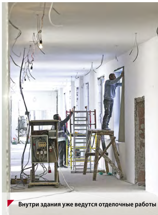
Внутри здания уже ведутся отделочные работы

будет расположен и современный спортивный стадион, на