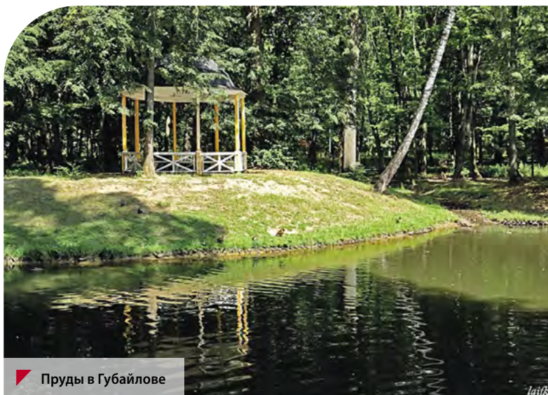
Пруды в Губайлово